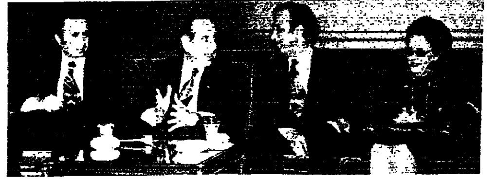
الرئيس شارل حلو في صالون الشرق بالمطار ، وتبدو السيدة عقبه والتقيب رياض طه ، ووزير عام وزارة الاعلام السيد رامي حازن

قال الرئيس شارل حلو « لتلاوة » قبل مغادرته لبنان أمس الى جنيف ، ان احد اسباب قيام الحكومة الحالية يكمن في صعوبة تكليف حكومة جديدة. ان لا تحول دون اعطاء حكم قوي ليبدأ بمطحي الى حد امكن من الامن وهدية السلطة. وكان الرئيس حلو قد غادر بيروت ظهر امس ، متوجها الى جنيف لترويض مؤتمر البرلمانيين الناخبين كليا او جزئيا باللغة الفرنسية ، وسيبقى الرئيس حلو اكثر من 20 يوما بين جنيف وباريس وروما. وما قاله الرئيس حلو : اننى اؤكد الصعوبات التي تعيقها هذه الحكومة ، والتي لم يكن في مقدورها ان تجتهد ، وان عددا من هذه المشكلات والمآسي سوف تعترض عمل اية حكومة ، الا ان ذلك لا يمنعني من ان اعرب عن اعتقادي بانه ان الارواح لافعال الراي العام دليلا على انه بإمكان ان تتكف حكومة من اشخاص يتمتعون بروصيد ضخم ، ويرتكون ذممة كآلوف وينتفون شعورهم بالمسؤولية ، بشكل يسهم في اعادة الطمأنينة الى النفوس والهشوه الى الشارع.